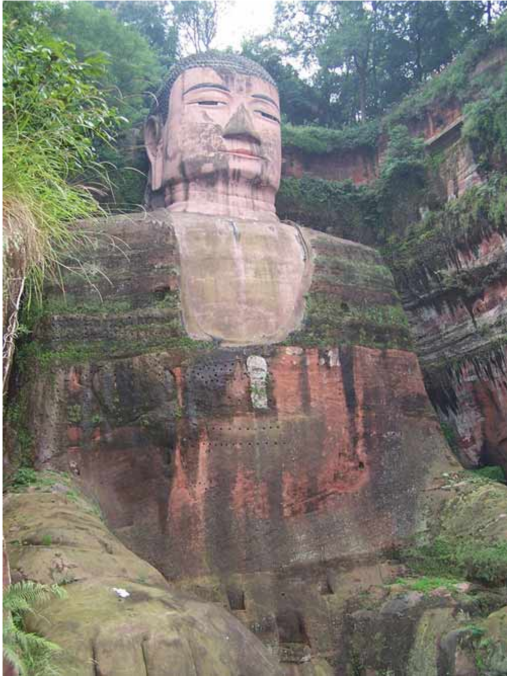
Người dân sống ở khu vực này cho biết, dãy núi nơi tạc tượng Lạc Sơn Đại Phật có hình dáng Phật đang ngủ. Ảnh: Wikipedia. T. Zing