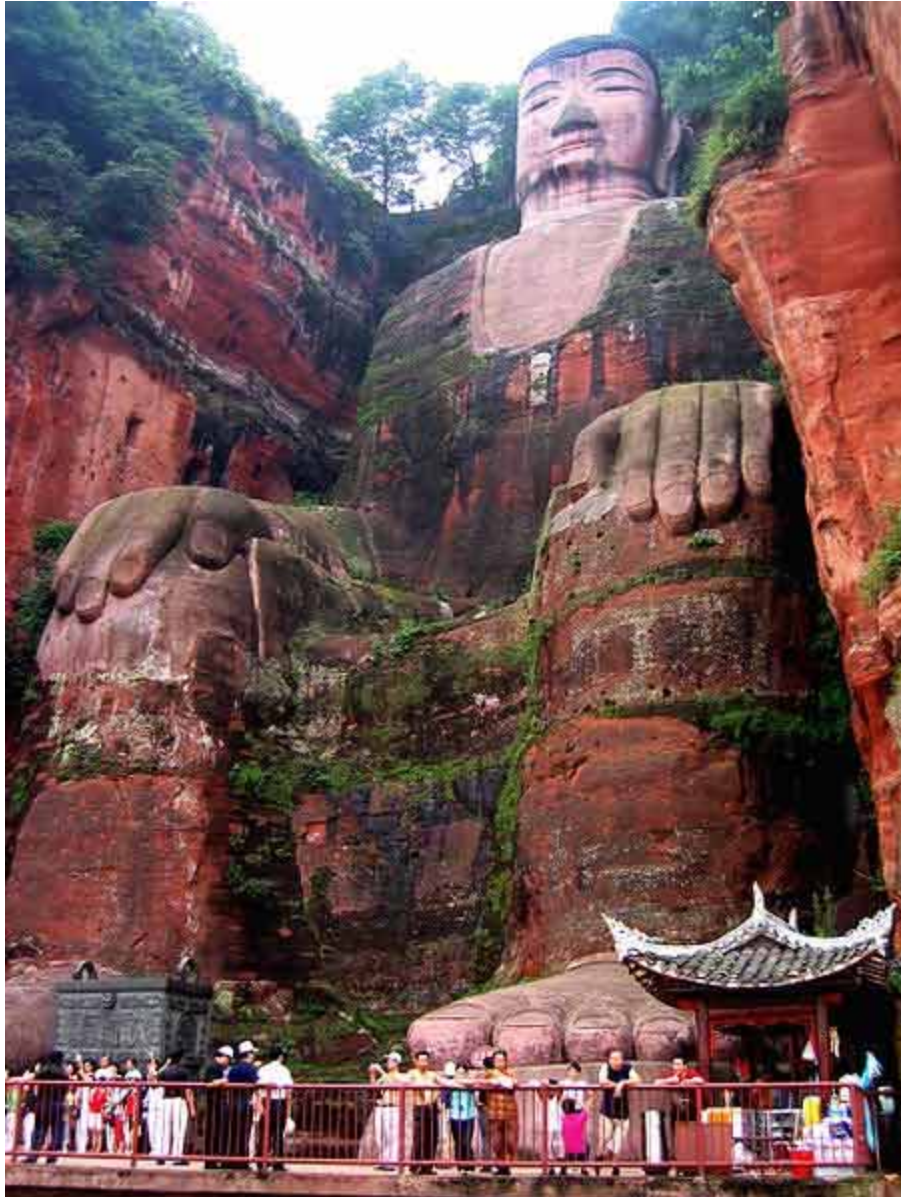
Đầu tượng có 1.021 búi tóc trong khi một người trưởng thành ngồi lọt móng tay nhỏ nhất của bức tượng.