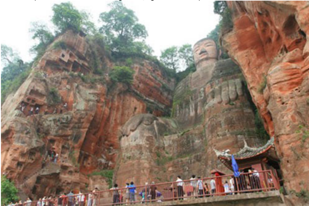
Năm 1996, Tổ chức Giáo dục, Khoa học và Văn hóa Liên Hiệp Quốc (UNESCO) đưa núi Nga Mi, bao gồm cả khu vực có tượng Lạc Sơn Đại Phật vào danh sách di sản thế giới.