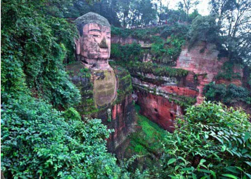
Trải qua hơn 1.200 năm lịch sử, tượng đá Lạc Sơn Đại Phật vẫn thu hút rất đông người thăm viếng. Tháng 2/1982, Quốc vụ viện Cộng hòa Nhân dân Trung Hoa đưa tượng Lạc Sơn Đại Phật vào danh sách quần thể văn hóa – tôn giáo trọng điểm toàn quốc.