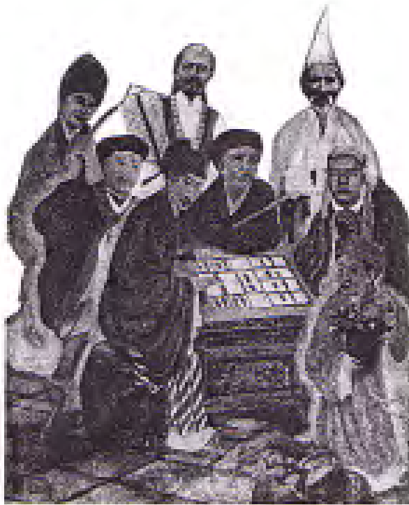
BÁT TIÊN CAO ĐÀI VÀ ĐÀI CỜ HUYỀN BÍ TỰ BI SANG CHÁI Hàng sau cùng: 1. Huyền Tiên Nữ 2. Cao Đền Tiên Nữ 3. Cao Đền Tiên Nữ Hàng giữa: 1. Lữ Đồng Tân 2. Trương Quả Lão 3. Hà Tiên cô Hàng trước: 1. Hồ Quốc Cự 2. Lữ Đồng Tân

phấn chỉ lấy cặp sanh vừa gõ nhịp vừa ca được Đức Phật Mẫu thưởng đào tiên và rượu bồ đào.