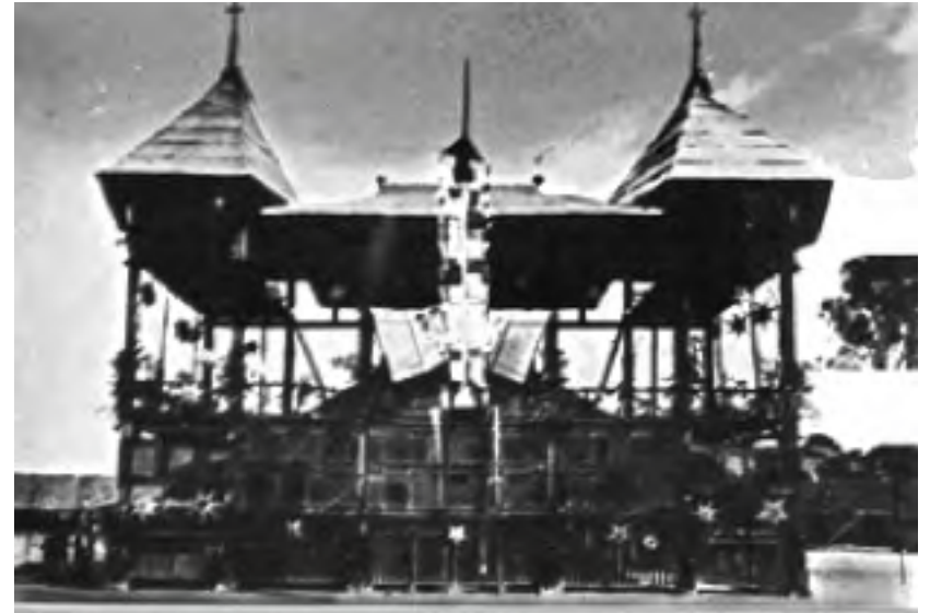
Cao Đài Tây Ninh - Thánh thất tạm 1927 (ảnh tài liệu)

Sau đó, Đức Lý giảng cơ thu nhỏ hoạ đồ lại như sau :