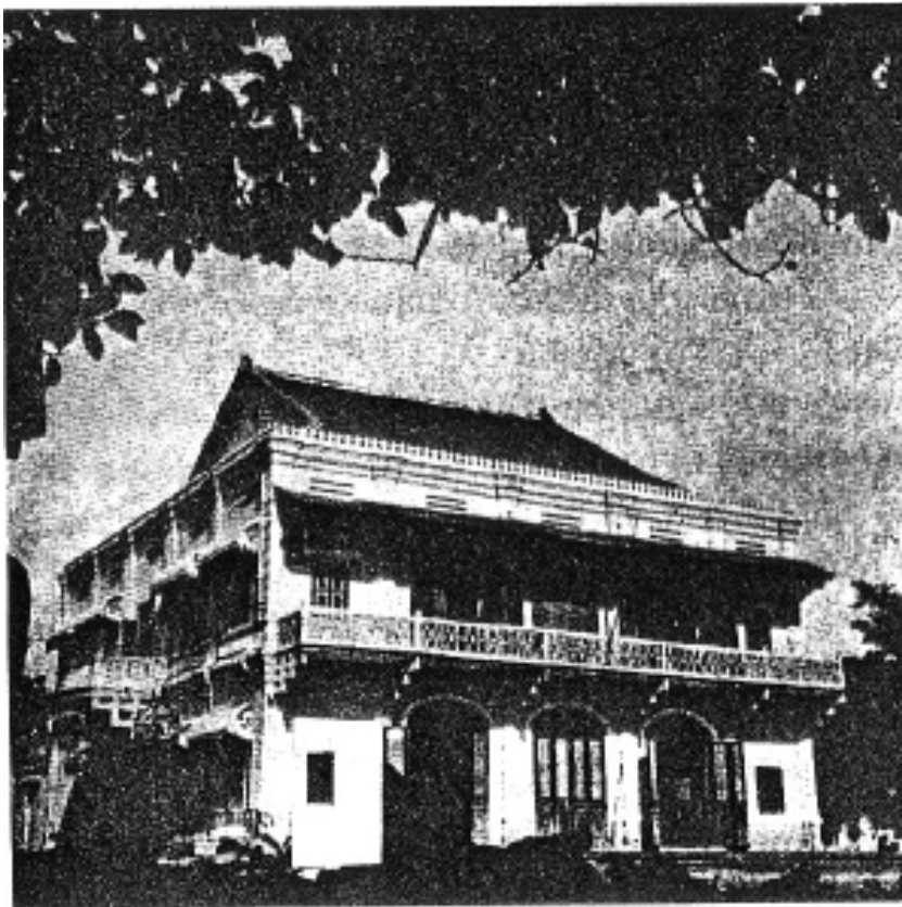
GIÁO TÔNG ĐƯỜNG NĂM 1932 NƠI LÀM VIỆC VÀ AN DƯỠNG CỦA ĐỨC QUYỀN GIÁO TÔNG LÊ VĂN TRUNG

Thuở ban đầu , Đức Qu. Giáo Tông vào Đạo chưa được bao lâu, Đức Lý Thái Bạch giảng đàn vào đêm 27-1-1926 dạy Ngài như sau :