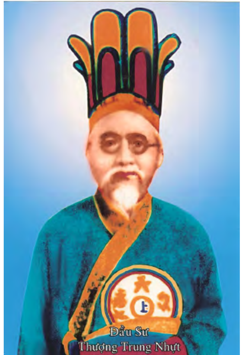
Đầu Sư Thượng Trung Nhựt