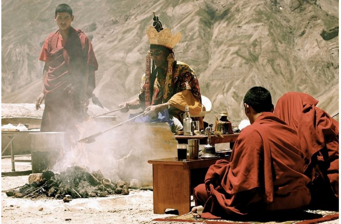
Lễ hỏa tịnh