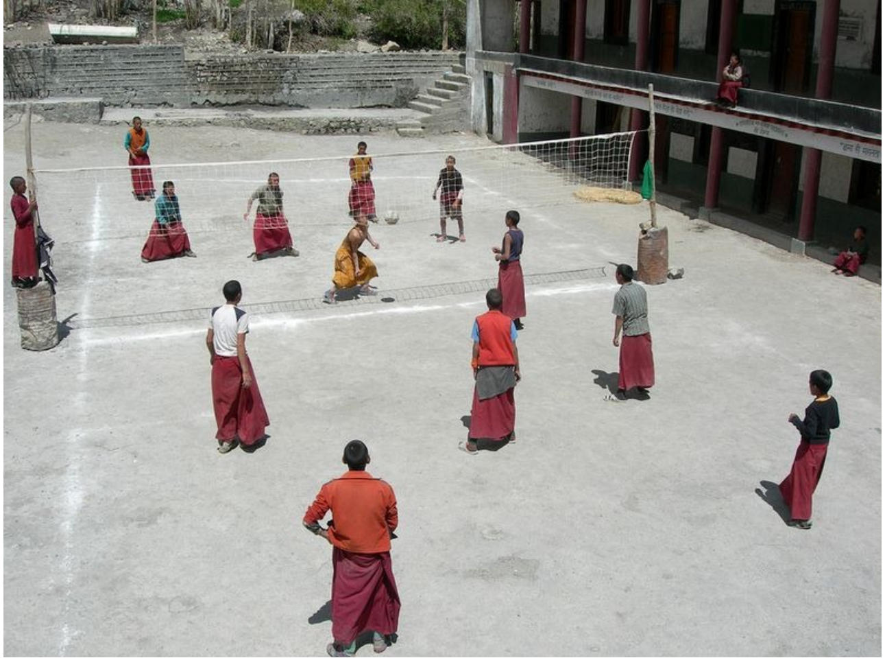
Chơi bóng chuyền trong sân tu viện.