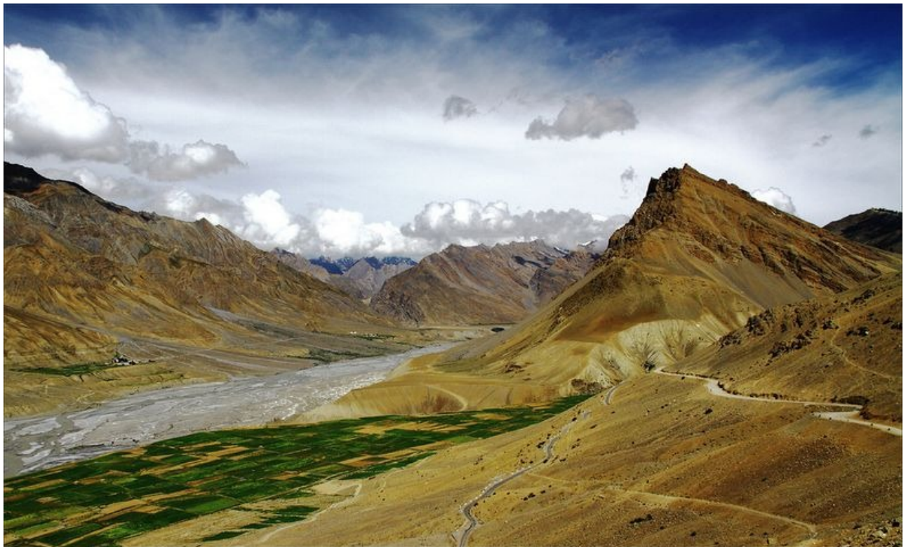
Sông Spiti phía sau tu viện Key Gumpa.