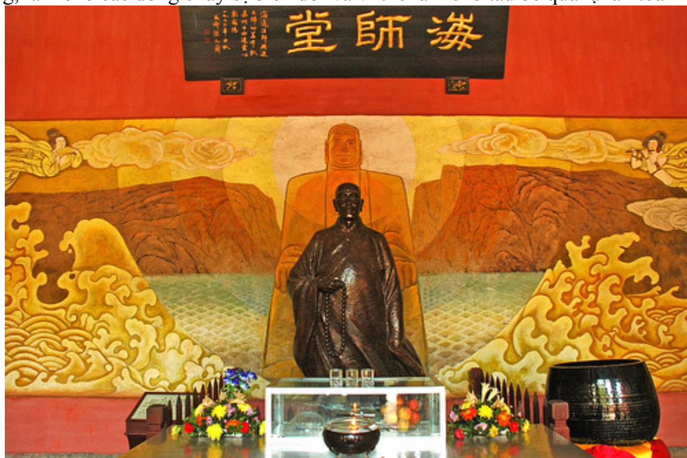
The guy who built the Giant Buddha

sông, làm cho các dòng chảy bị biến đổi và vì thế làm cho tàu bè qua lại an toàn hơn.