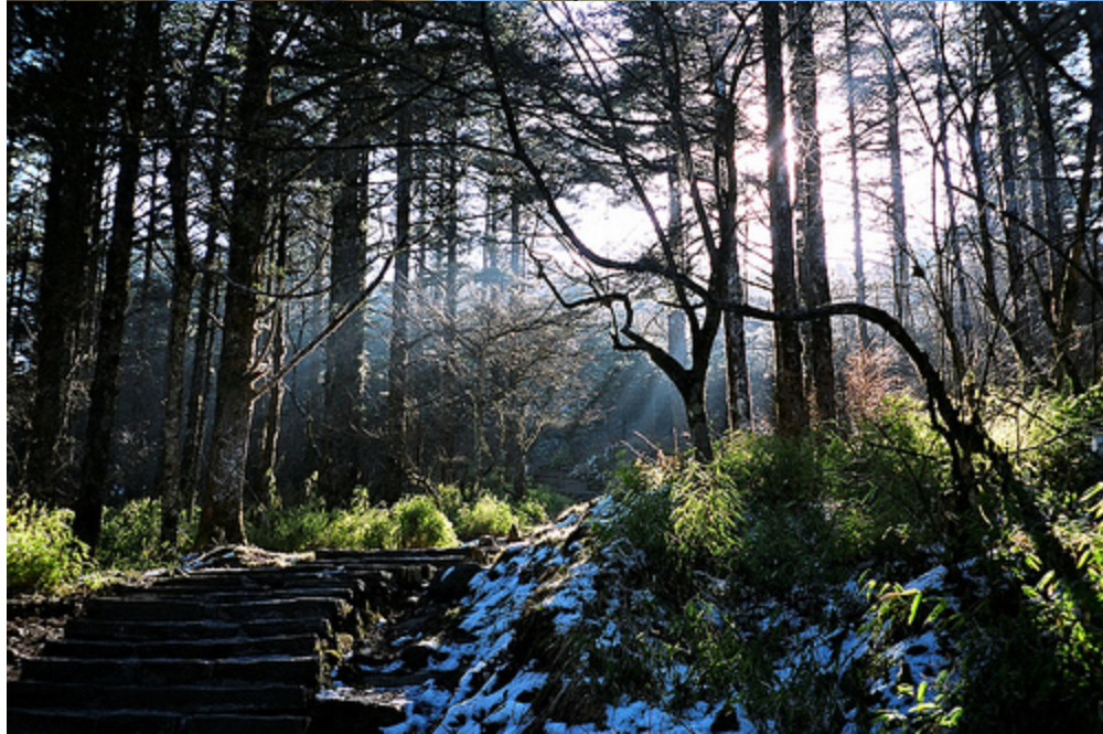
Đỉnh cao nhất của Nga Mì sơn là đỉnh Vạn Phật của ngọn núi chính Kim Đỉnh, với độ cao 3.099 m. Với địa thế cao chót vót, phong cảnh đẹp nên người ta nói tới Nga Mì sơn như là "Nga Mì thiên hạ tú".