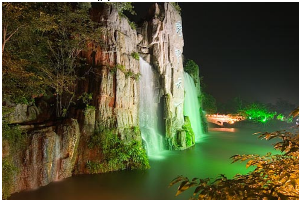
Emei Lake ( Hồ trên núi Nga Mi )