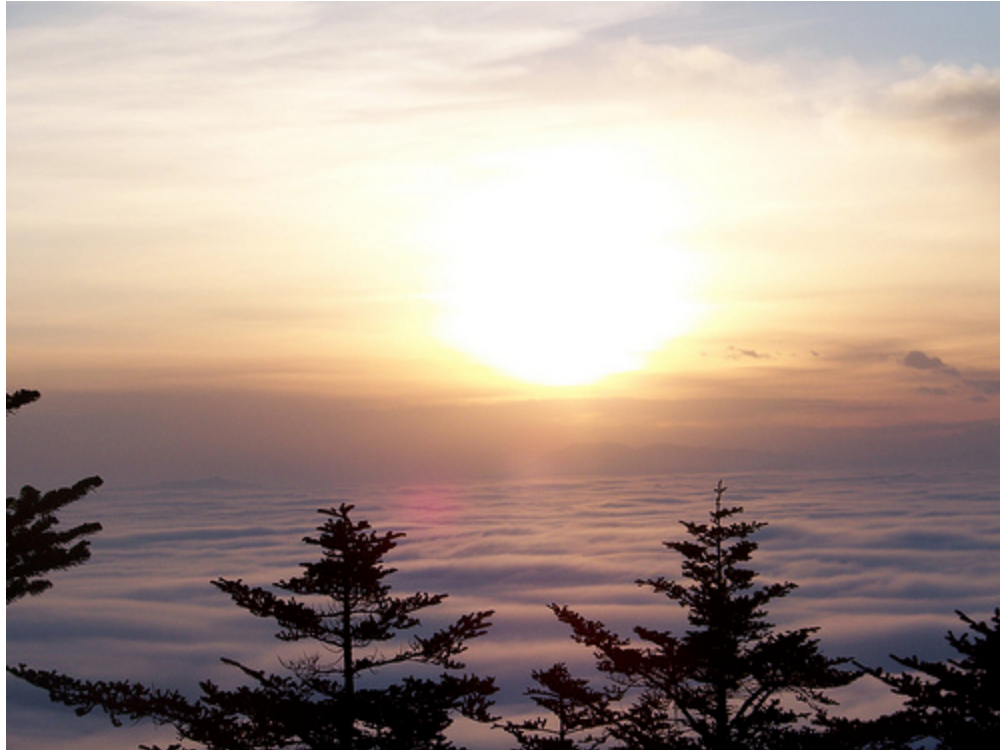
Khu vực Nga Mi sơn có nhiều sương mù, thiếu nắng, lượng mưa dồi dào.