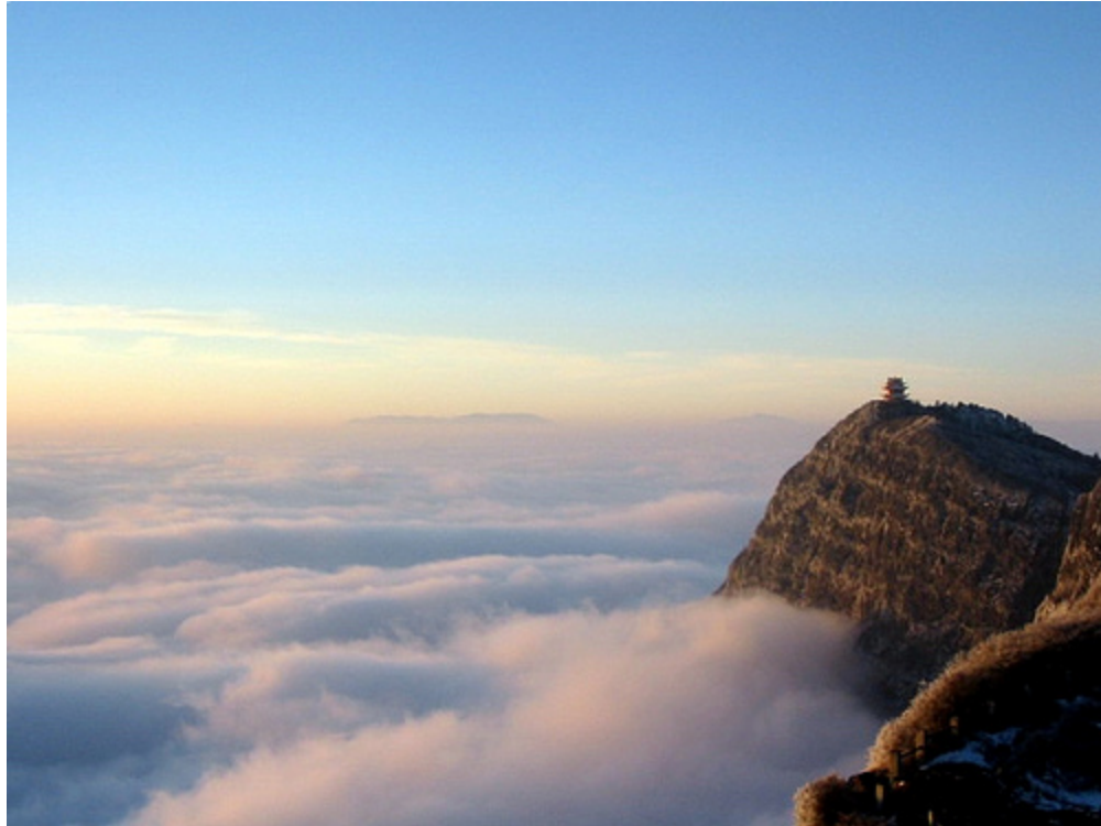
Golden Temple on Mt. Emei